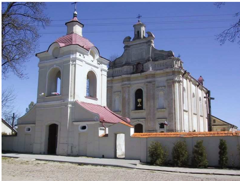
Rysunek nr 2. Kościół parafialny pod wezwaniem Świętego Jana Chrzciciela

Ponadto na obszarze miejscowości znajdują się obiekty figurujące w ewidencji dóbr kultury gminy Baranów: pozostałości zespołu dworskiego, obejmujące lamus, mur. XVIII w. i pozostałości parku, XVIII w., budynek „Nowej Apteki” przy ul. Błotnej, mur. 1928 r., dom przy ul. Puławskiej, I poł. XX w., cmentarz parafialny, 1829 r., cmentarz żydowski, I poł. XVII w.