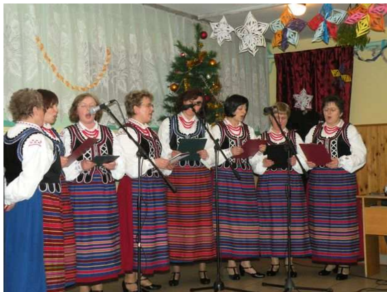
Rysunek nr 3. Przegląd kolęd i pastorałek z 2008 r.

koncerty, Zwiedzanie zabytków i miejsc upamiętniających wydarzenia historyczne na terenie gminy, Dożynki Gminne, Święto pieczonego ziemniaka, "Król grzybobrania", Gminne Obchody Święta Odzyskania Niepodległości, Warsztaty bożonarodzeniowe, Przegląd Kolęd i Pastorałek.