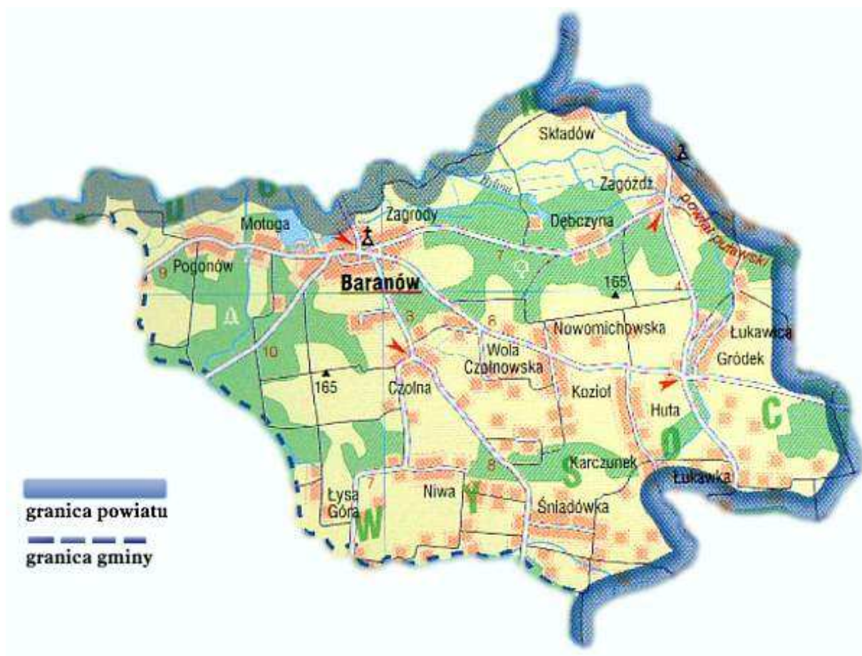
Mapa 1. Układ przestrzenny gminy

Powierzchnia Baranowa wynosi 28 km 2 , co stanowi 32 % całkowitej powierzchni gminy. Miejscowość zamieszkuje 1690 osób, co stanowi 39 % ludności gminy. W Baranowie mieści się siedziba władz gminy. Miejscowość jest położona w odległości 20 km od Puław (siedziba władz powiatu) i 65 km od Lublina (siedziba władz województwa).