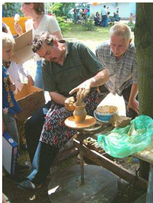
Rysunek nr 4. Pokaz garncarstwa w Baranowie