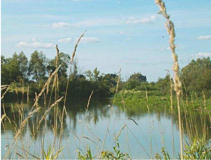
Rysunek nr 1. Rzeka Wieprz