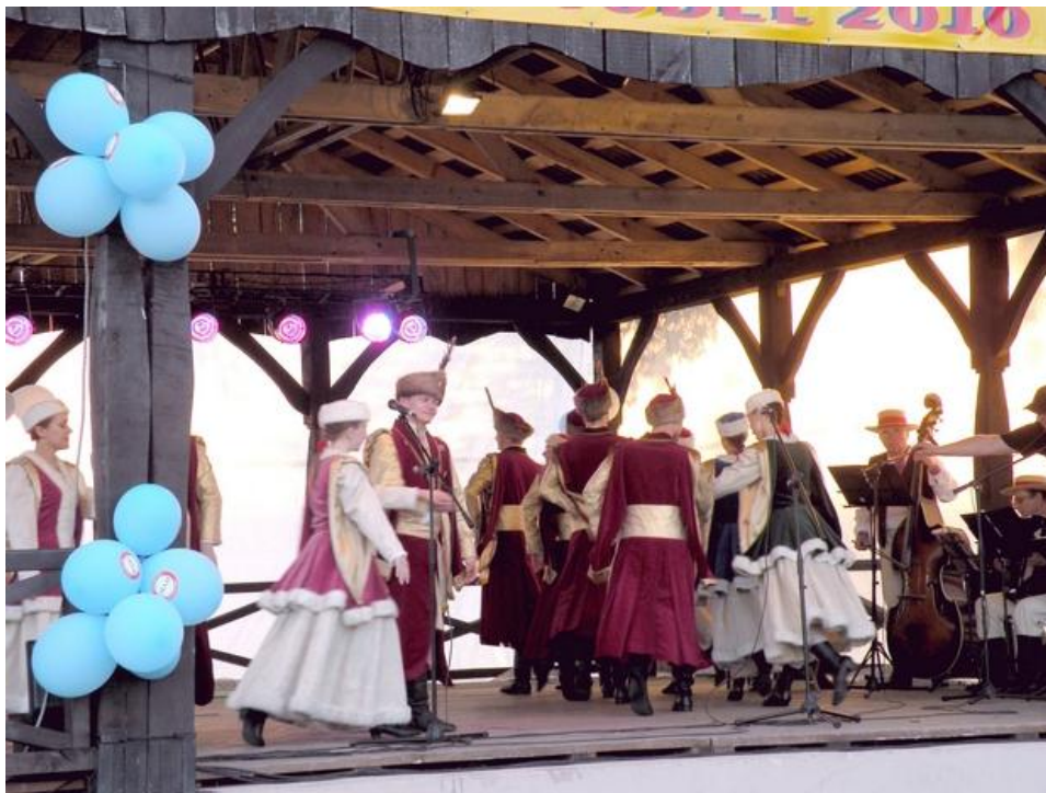
Rysunek nr 5. Międzynarodowy Festiwal Tańców GODEL 2010