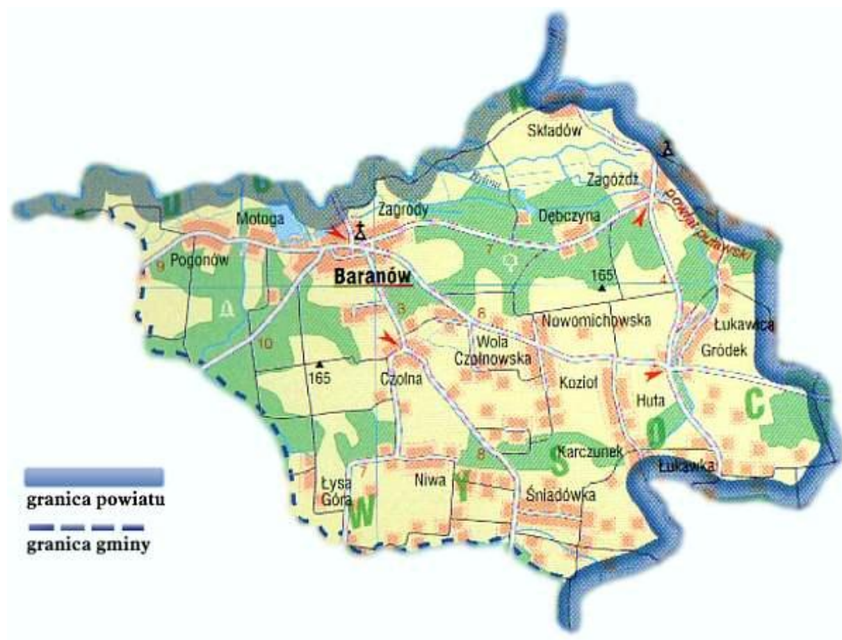
Mapa 1. Układ przestrzenny gminy Baranów i położenie miejscowości Śniadówka

Miejscowość zamieszkuje 337 osób, co stanowi ok. 8 % ludności gminy Baranów. Śniadówka jest położona w odległości 6 km od Baranowa (siedziba władz gminy), 25 km od Puław (siedziba władz powiatu) i 70 km od Lublina (siedziba władz województwa).