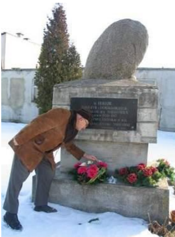
Rysunek nr 1. Pomnik upamiętniający ofiary masakry w Śniadówce