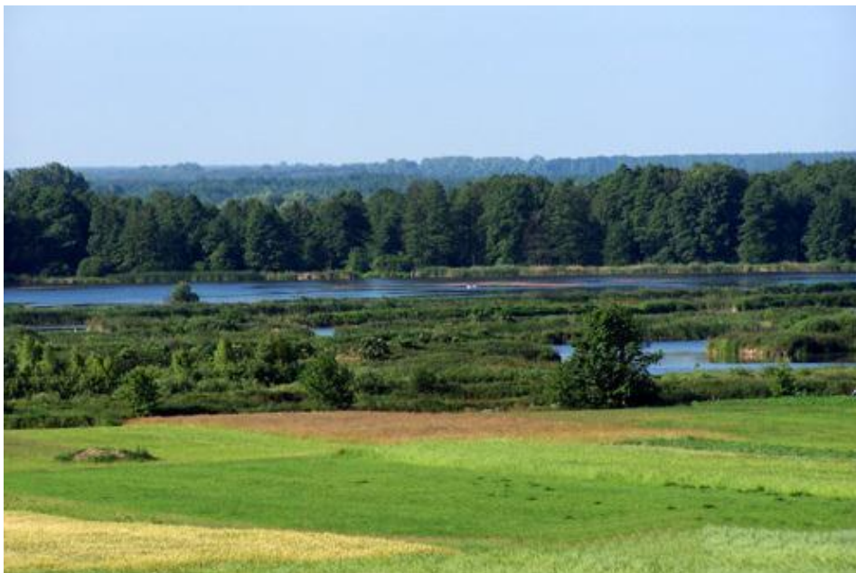
Rysunek nr 2. Rozlewiska rzeki Wieprz

zarastające starorzecza, a także fauny bezkręgowej (trzmieci i motyli), występującej na mało przekształconych i okresowo zalewanych łąkach. Bogata roślinność „Pradoliny Wieprza” stała się siedliskiem rzadkich gatunków ptaków m. in. perkozów, derkaczy, remizów, pustulek, łabędzi niemych, błotniaków, a także zwierząt: wydry, żółwia błotnego oraz bobrów.