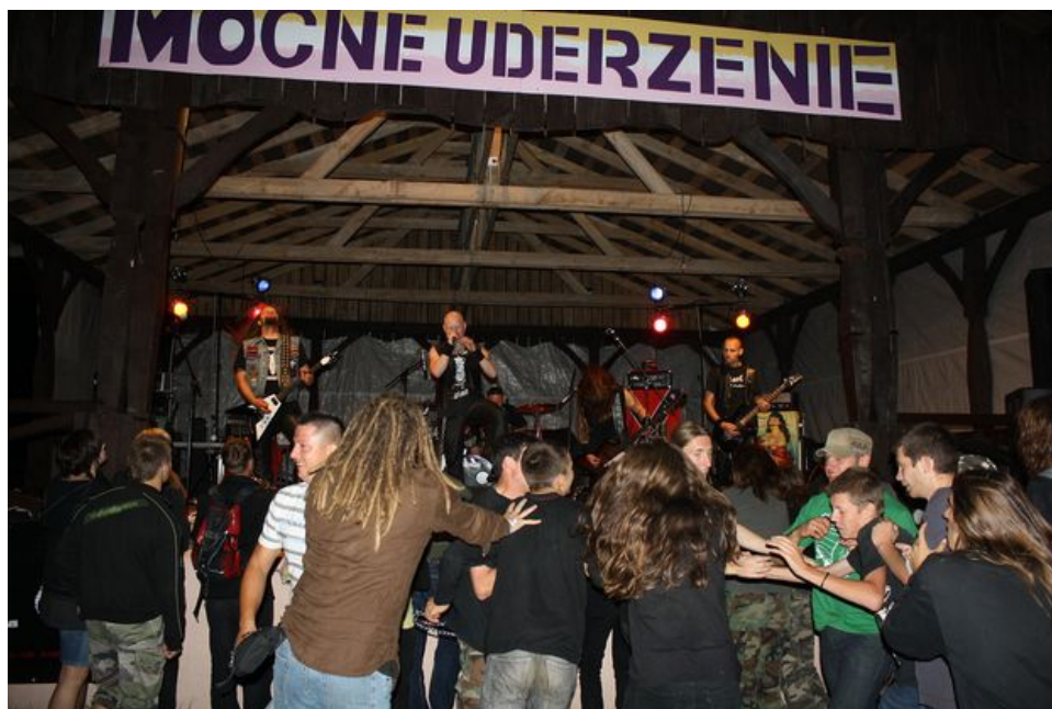
Rysunek nr 6. Przegląd Zespołów Rockowych Mocne Uderzenie II