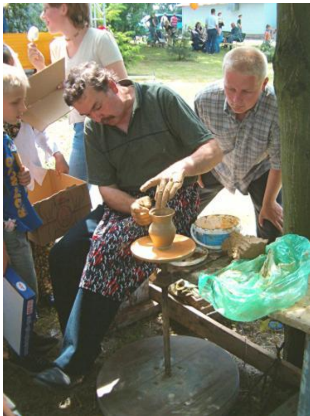
Rysunek nr 7. Pokaz garncarstwa w Baranowie