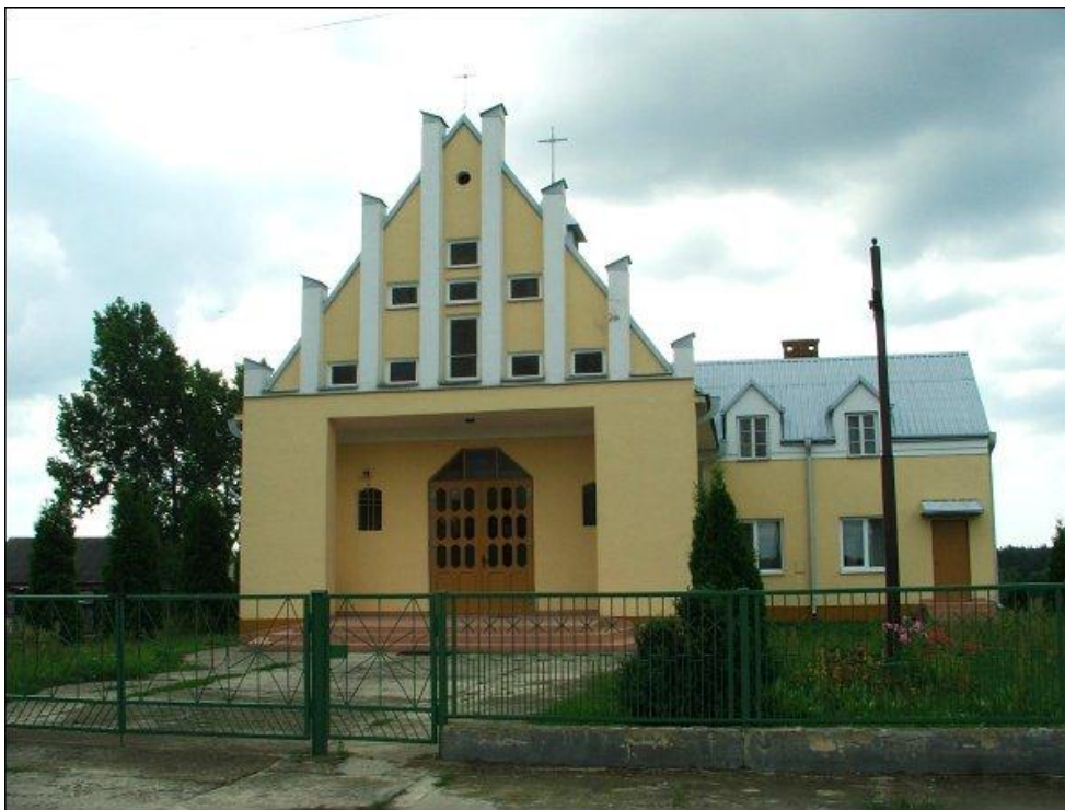
Rysunek nr 3. Kaplica pod wezwaniem NMP Wspomożenia Wiernych

Ponadto, potrzeby mieszkańców w zakresie zachowania tożsamości kulturowej i historycznej są zaspokajane w oparciu o infrastrukturę kulturowo-społeczną z terenu gminy.